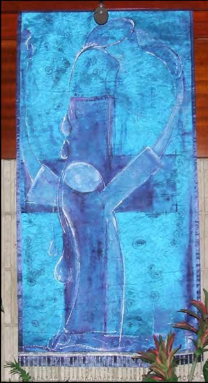
Kanselkleed vir reeks oor Geestelike Gewoontes: "Druppels vir die Dors" gemaak deur Annabelle Koen