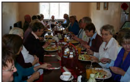
Afsluitingsfunksie op Vrydag, 24 Oktober by Café Ro-Anne gehou

Ons is almal by die Rubicon verby - vorentoe bruis die Jordaan, maar ons is nooit alleen nie.